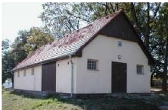
(úpravna vody, postavená na obecním pozemku vedle hřbitova)

Možnosti připojení na vodovodní řad využilo 170 domácností.