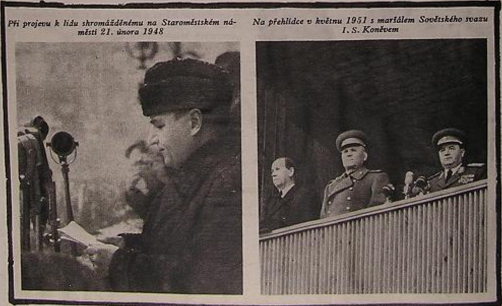
Při projevu k lidu shromážděnému na Staroměstském náměstí 21. února 1948