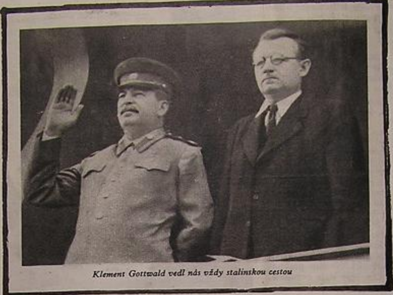
Klement Gottwald vedl nás vždy stalinskou cestou